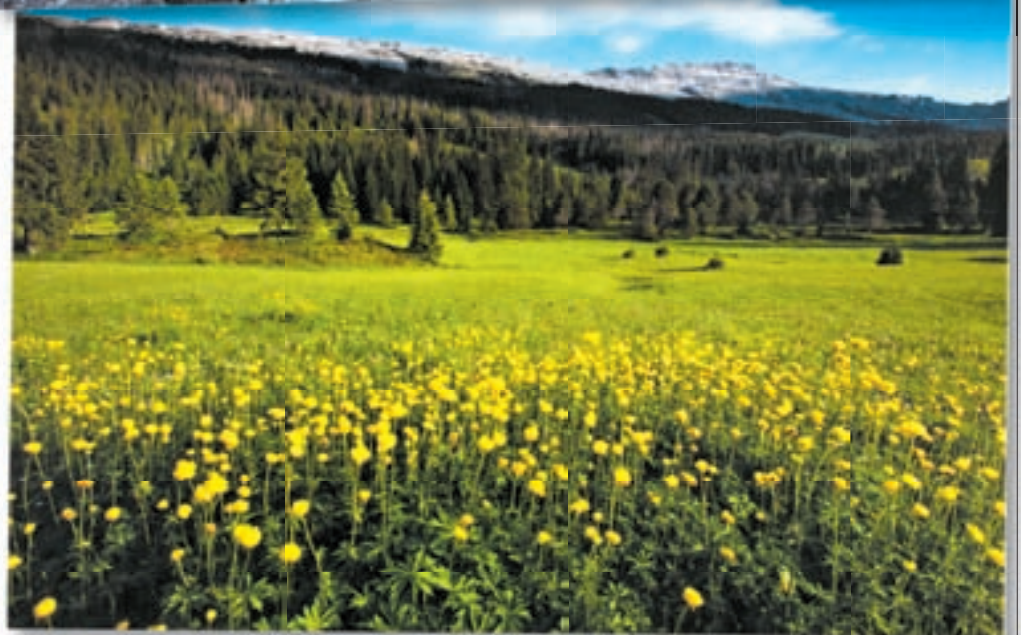
Natur pur als Lockmittel: Wiederbelebte Traditionen und unbefleckte Landstriche befeuern die Sehnsucht von Touristen aus dem In- und Ausland.

Oben Alpbazug vom Flimsenstein (GR) Unten Entlebuch (LU)