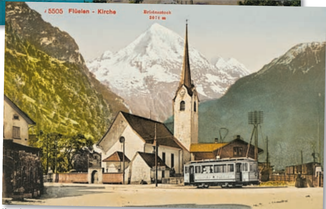
Photochrom-Idyll: Die Photochrom-Technik wurde in den 1880er-Jahren von Orell Füssli entwickelt. Seine Blütezeit erlebte dieses Flachdruckverfahren, das Fotografie und Farblithografie kombiniert, vor dem Ersten Weltkrieg.

Oben Der Quai in Brunnen (SZ) am Vierwaldstättersee, um 1900. Unten Die Kirche von Flüelen (UR) mit Bristenstock, um 1900.